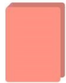
1 classeur souple (21 x 29,7 cm)