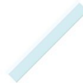
1 règle plate en plastique 30 cm