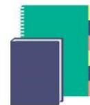
1 agenda ou cahier de textes (en fonction du cycle)