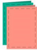
2 protège-cahiers (17 x 22 cm, 21 x 29,7 cm)