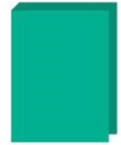
1 classeur rigide (21 x 29,7 cm)