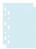
Pochettes transparentes perforées (21 x 29,7 cm)