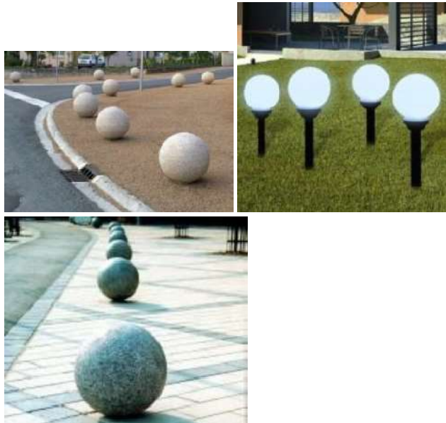
Les « ronds » dans notre environnement

Défi de P'tit Loup : comme sur les photos, trouve des objets en forme de « rond » ou avec des ronds dessus.