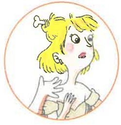
la maman de Lasco