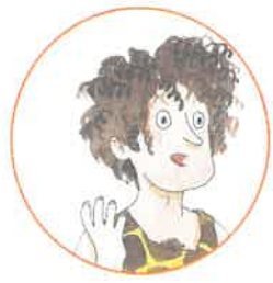
le papa de Lasco