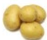
pomme de terre