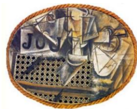
Pablo Picasso, nature morte à la chaise cannée, 1912