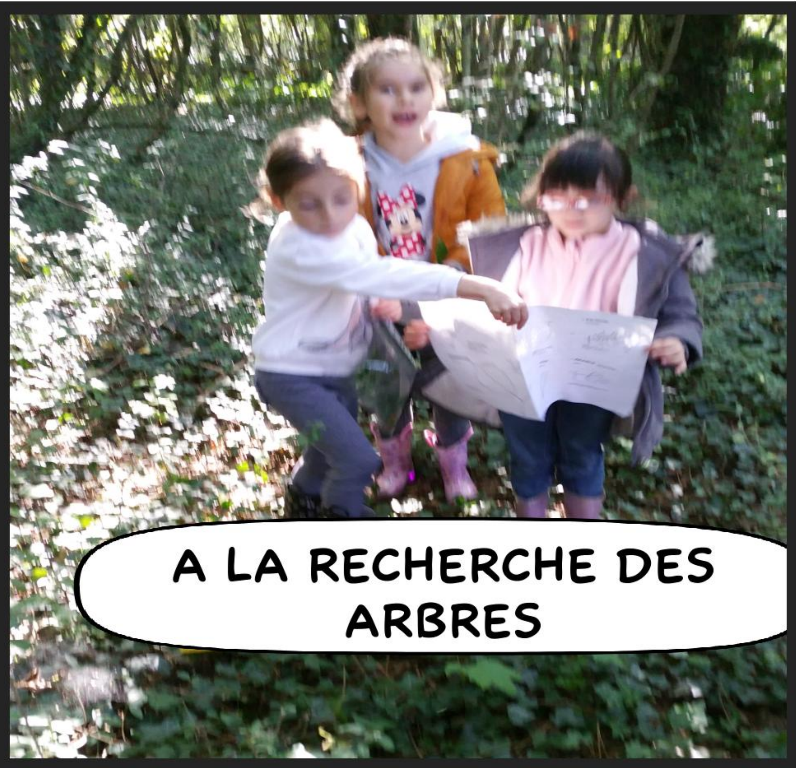
A LA RECHERCHE DES ARBRES