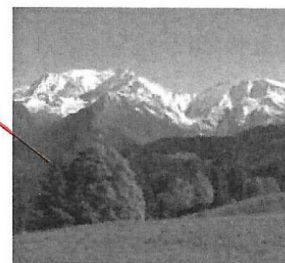
Le Mont Blanc 4 810 m

Vérifie tes réponses sur le livre numérique.