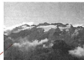
Le pic d'Aneto 3 404 m