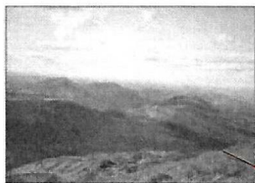
Le Plomb du Cantal 1855 m