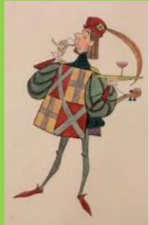
un laquais ( serviteur)