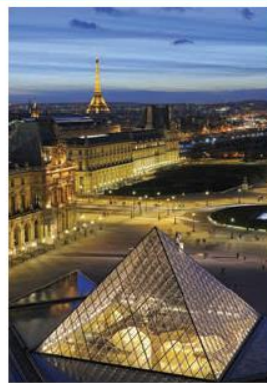
Le Louvre avec la pyramide