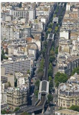
Le métro aérien