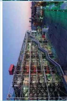
Le Centre Pompidou