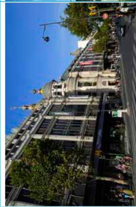
Le Printemps Haussman