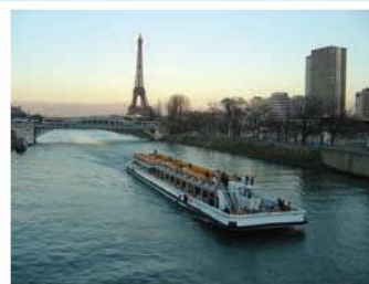
La Seine et les bateaux-mouches