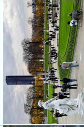
La tour Montparnasse