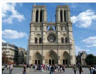
La cathédrale Notre-Dame de Paris