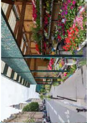
Le marché aux fleurs