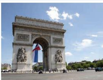
L'Arc de triomphe