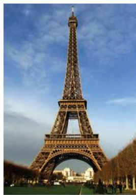
La tour Eiffel