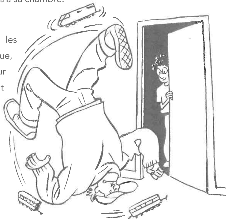
© D'après Drôle de samedi soir ! Claude Klotz. Éditions Hachette Toboggan.

L'homme grogna, fit deux pas, se prit les pieds _ _ _ _ la locomotive du train électrique, se rattrapa _ _ justesse _ _ _ _ _ le mur et lorsqu'il eut repris son équilibre, il entendit _ _ _ _ _ lui un double tour _ _ _ _ _ clef !