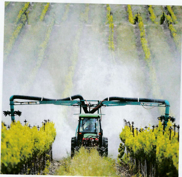
▲ Doc. 4 : L'agriculture utilise des substances chimiques qui peuvent polluer les eaux des rivières.

► Les activités humaines ont des conséquences sur le milieu naturel.