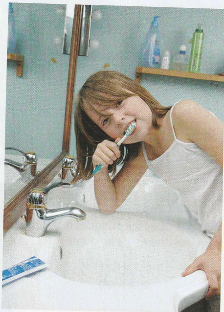
▲ Doc. 6 : ... je veille à ne pas gaspiller l'eau au quotidien.

? Quels gestes quotidiens peux-tu faire pour économiser l'eau (Doc. 5 et 6) ?