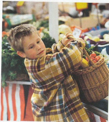
▲ Doc. 8 : ... je n'utilise pas de sacs plastiques.

? Que peux-tu faire pour aider à protéger la biodiversité (Doc. 7 et 8) ?