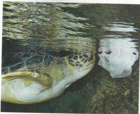
▲ Doc. 7 : Pour éviter la disparition de certaines espèces comme la tortue...