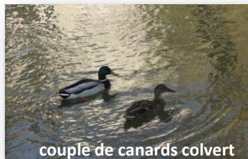
couple de canards colvert