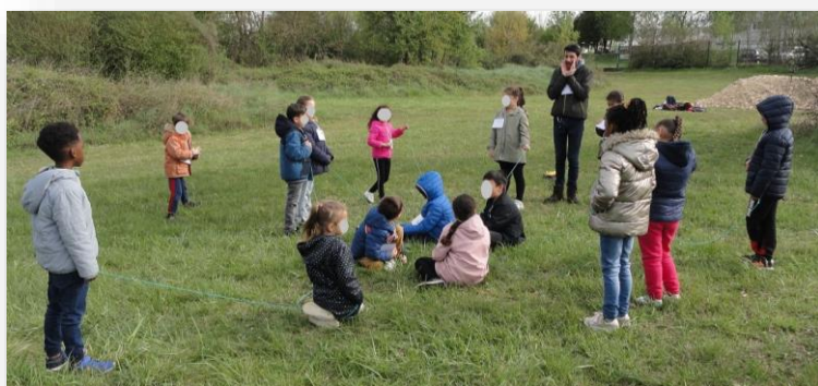
Découvertes les chaînes alimentaires : chaque enfant est un animal ou un végétal et chacun est relié à ce qu'il mange