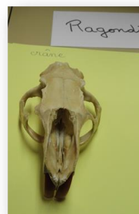
crâne de ragondin