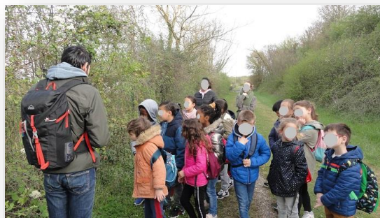
Sortie à la journée en mai autour de l'école, avec observation de petits oiseaux et de

Les élèves ont été très intéressés par ce projet : certains ont préféré les sorties, d'autres l'observation des crânes et d'autres le mime de l'arbre. Ce projet permet aux élèves de découvrir des endroits proches de chez eux où ils ne vont pas forcément en famille ou d'une autre façon. Certains y sont retournés pour observer les oiseaux et la nature avec leurs parents. Ils ont également observés les oiseaux à l'école et dans leur jardin. Ce projet a été prolongé par une sortie pédagogique aux jardins de Saint Fraise avec un atelier sur les petites bêtes et la découverte des jardins notamment.