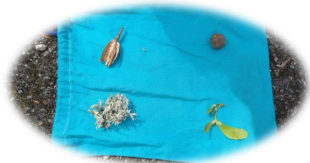
jeu de recherche/d'observation/mémorisation d'éléments trouvés à Foulpouagne.