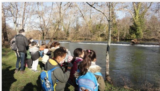
Elèves observant la Touvre et ses berges avec ou sans jumelles