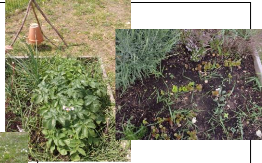
Plantation de pommes de terre et semis de salades