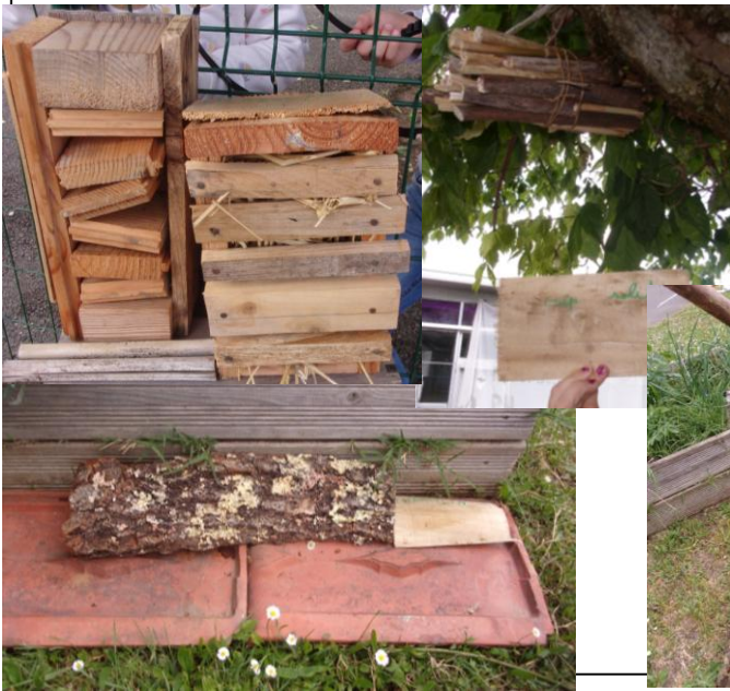
Fabrication et installation d'hôtels à insectes: coccinelles, guêpes, chrysopes, pince-oreilles, staphylins...