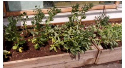
Semis de fèves, petit-pois et radis: tous les matins, plaisir de voir les légumes pousser et prendre forme.