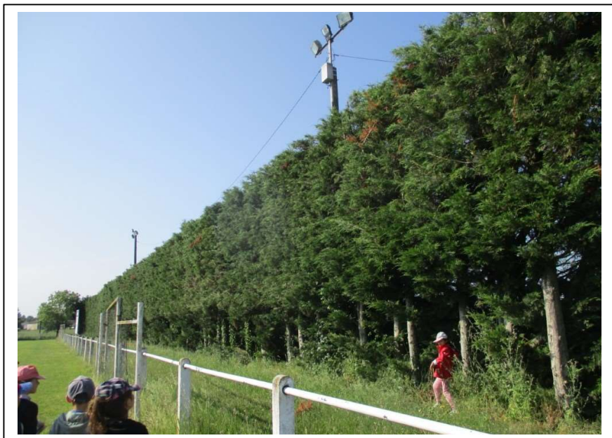
Observation d'une haie des villes (une seule espèce d'arbres), suivi d'un dessin d'observation