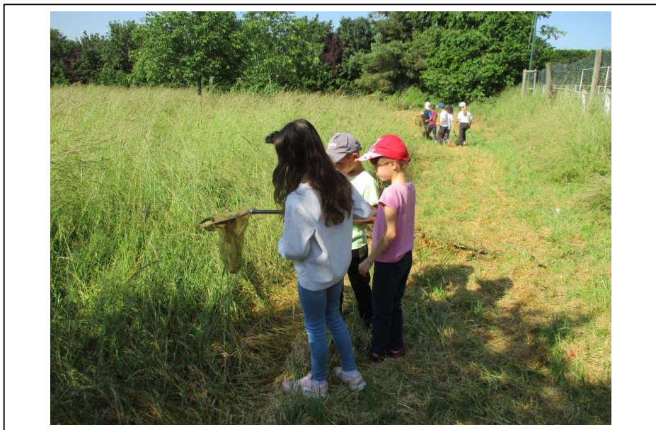
Chasse aux « petites bêtes » dans la prairie, à la main ou grâce à un filet à papillon

Au cours des différentes animations, les élèves ont appris à observer, se documenter, identifier et dessiner de manière rigoureuse.