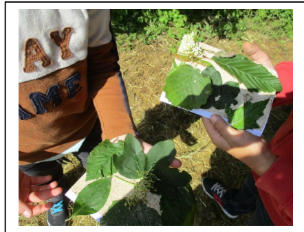
Créations obtenues grâce à la cueillette des feuilles de la haie des champs

Par son aspect ludique, il a permis de sensibiliser davantage à la fragilité de la biodiversité et à sa nécessaire préservation. Les élèves se sont montrés plus méticuleux pour observer, prélever des espèces pour les étudier et les relâcher dans leur milieu. Ils ont pris conscience de la nécessité de préserver tous les êtres vivants, végétaux et animaux.