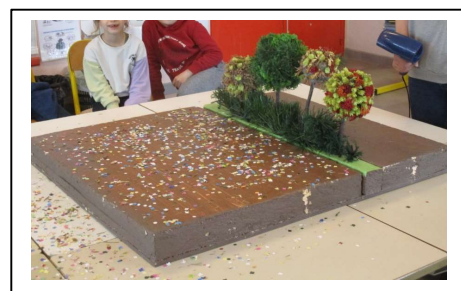
Maquette de la haie protégeant les blés confettis

Les élèves ont d'abord découvert les différents atouts de la haie, notamment en termes de protection des cultures agricoles et de préservation de la biodiversité. Puis ils ont observé et identifié différents types de haie (de villes, des champs) et espèces d'arbres. Ils ont ensuite prélevé et observé des « petites bêtes » de la prairie. Enfin, ils ont joué autour des relations alimentaires des êtres vivants pour mettre en valeur la notion de réseau.