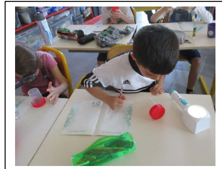
Observation des « petites bêtes » à la loupe et dessin au crayon