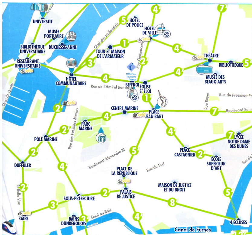
a. Plan de Dunkerque (Nord) qui indique la durée des déplacements à pied.