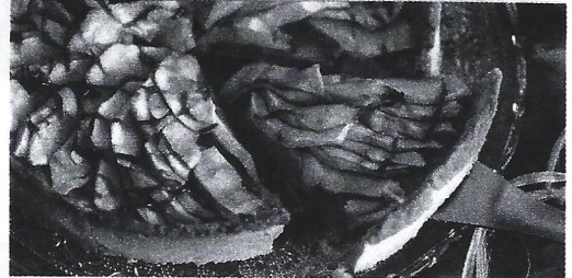
DOC. 1 Une tarte