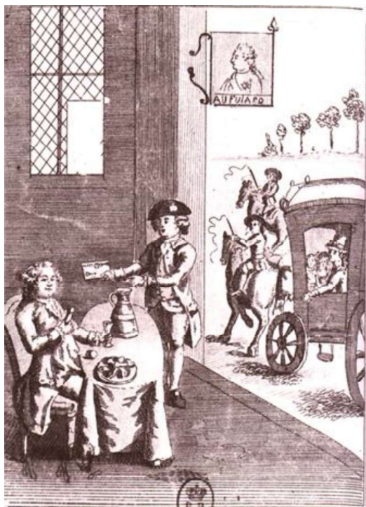
Le Roi mangeant des Pieds A la Sainte Menegole Le Maître de poste Confronte un Cassinot Et Reconnoit Le Roi.