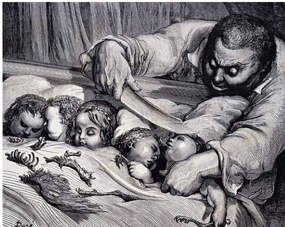
À tâtons : Il se dirige avec ses mains, dans le noir.

« L'ogre peut toujours changer d'avis et décider de nous manger » se dit-il. Alors il se leva et prit les bonnets de ses frères qu'il alla tout doucement mettre sur la tête des filles de l'ogre, après leur avoir retiré leurs couronnes.