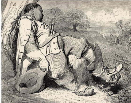
S'adapter aux pieds Les bottes se mettent à la bonne taille.

Le Petit Poucet dit à ses frères d'aller retrouver leurs parents, puis, une fois seul, il s'approcha de l'ogre, et doucement, tout doucement, il lui enleva ses bottes et les mit à ses pieds. Et comme elles étaient magiques, les grandes bottes de l'ogre s'adaptèrent parfaitement aux petits pieds du Petit Poucet.