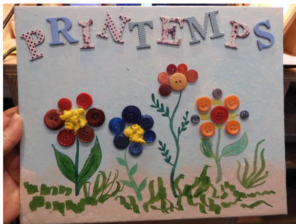
TABLEAU DE PRINTEMPS