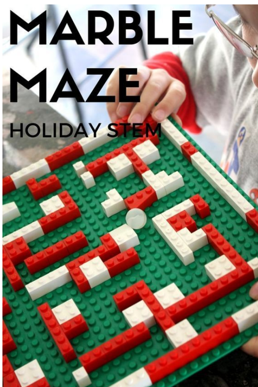
Pour travailler la coordination des mouvements (créer un labyrinthe avec des légos), on doit incliner la plaque pour faire sortir la bille (plutôt à partir de la MS)