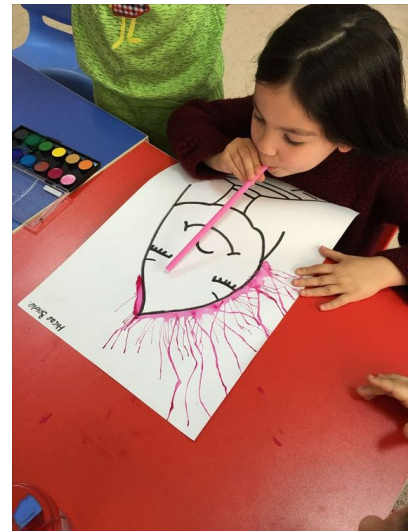
encre et paille : on souffle pour guider la peinture . On peut coller des gommettes sur la feuilles, l'encre doit éviter les gommettes.