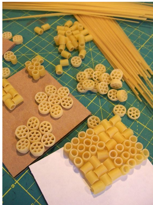
Des collages avec des pâtes.