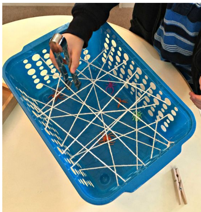
tendre des fils sur une corbeille à linge, placer des objets au fond, avec une pince à barbecue, aller chercher les objets sans toucher la ficelle.