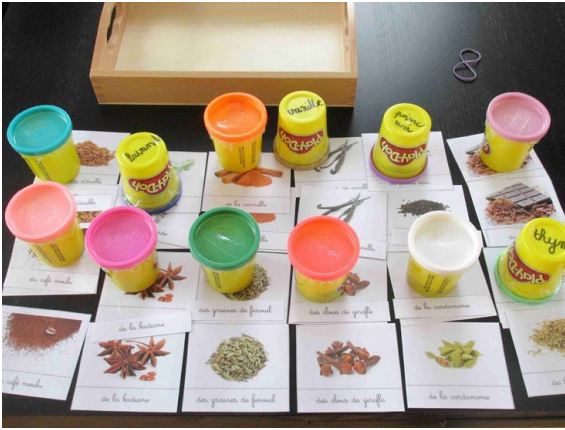
Créer un loto des odeurs avec les épices et / ou les herbes aromatiques de la maison.