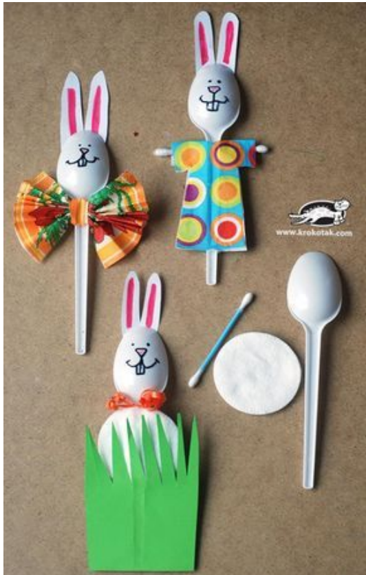
Avec des cuillères à soupe jetables (lapin de pâques).