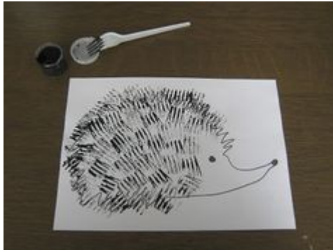
peinture avec une fourchette