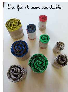
Du fil et mon cartable