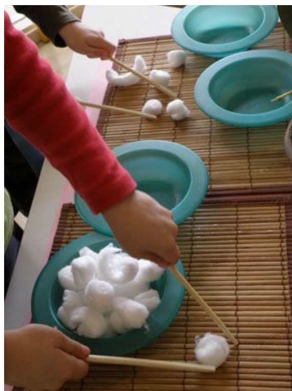
Déplacer des objets avec 2 baguettes (les objets mous seront plus faciles à déplacer que les objets durs).