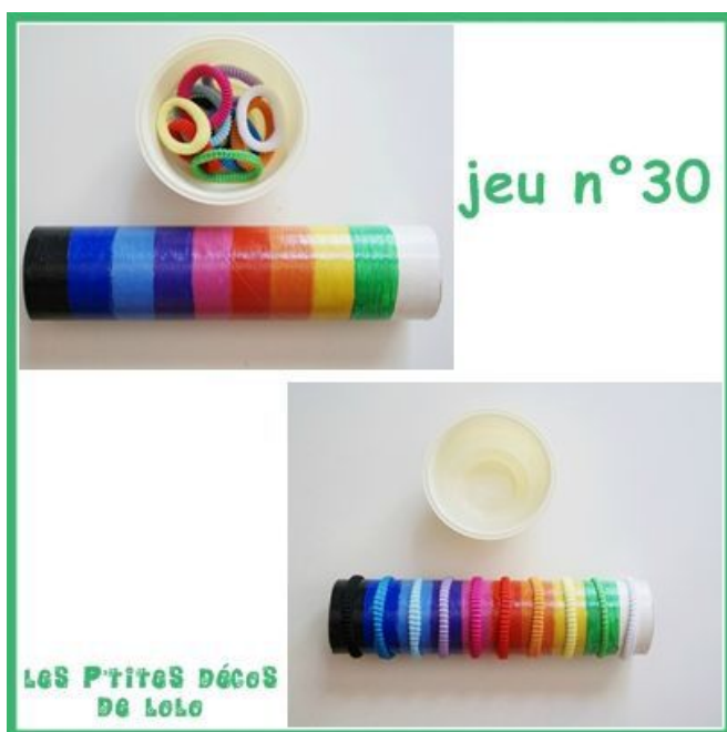
Placer les élastiques sur un rouleau (avec association de couleurs)