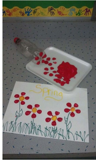
peinture avec des fonds de bouteilles