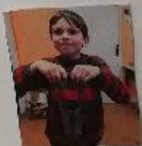
un plantoir à billes

Il sert à planter des billes et aussi à faire des trous.