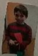
La serfouille pour les fougères

Elle sert à arracher le sal et à fougères fougères.