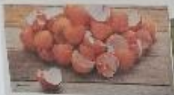
Des coquilles d'œufs