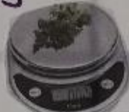
Une planche à découper