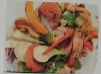
Des déchets alimentaires