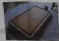
Une balance électrique