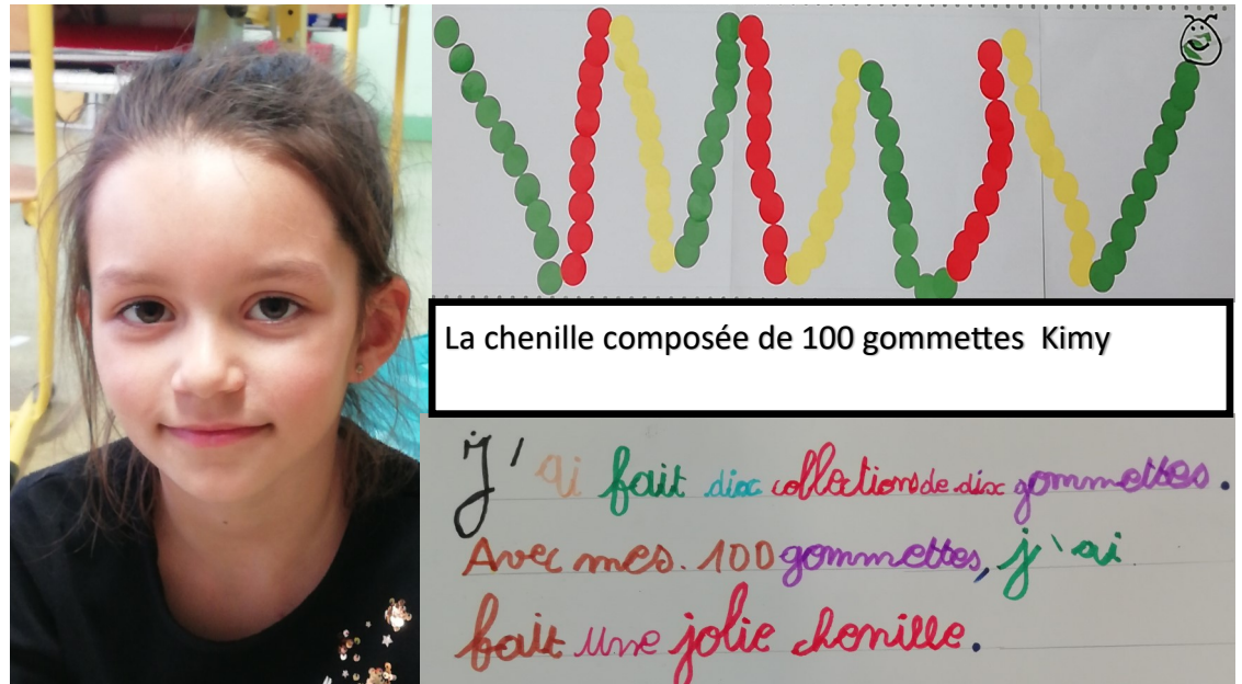
La chenille composée de 100 gommettes Kimy

J'ai fait dix collections de dix gommettes. Avec mes 100 gommettes, j'ai fait une jolie chenille.