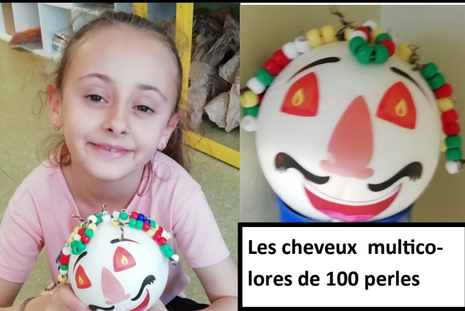
Les cheveux multicolores de 100 perles

J'ai fait une collection de 100 perles. J'ai enfilé les perles pour faire des cheveux sur la tête.