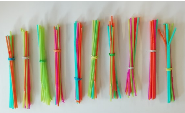
La collection de 100 pailles attachées par 10 Israël

10 + 10 + 10 + 10 + 10 + 10 + 10 + 10 + 10 = 100 j'ai 100 pailles israël