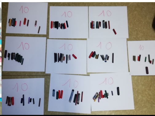
La collection de 100 crayons Lorenzo